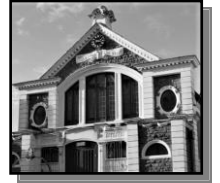
Hen Lyfrgell Pentre'r Eglwys

sefydliadau dyngarol niferus sydd wedi 'cyfoethogi' bywydau miliynau lawer mewn nifer o wledydd. Ond roedd yn ddigon hirben i ofalu nad oedd ei waddol yn cael ei afradu gan fynnu amodau a olygai bod y cyfrifoldeb am gynaliadwyedd prosiectau dros amser yn disgyn ar ysgwyddau'r gymuned oedd yn elwa o'r nawdd. Er enghraifft, talu am godi'r adeilad oedd cyfraniad ymddiriedolaeth llyfrgelloedd cyhoeddus Carnegie, ar yr amod bod yr awdurdod lleol yn gofalu am gyflogi staff ac archebu stoc o lyfrau. Codwyd llyfrgelloedd cyntaf Carnegie mewn lleoliadau roedd ganddo gysylltiad personol â nhw megis ei dref enedigol, Dunfermline a'i dref fabwysiedig yn UDA. Erbyn diwedd y 1920au roedd dros 2,500 o 'lyfrgelloedd Carnegie' wedi eu codi, yn bennaf yn UDA a Phrydain. O'r rhain roedd nifer yma yng Nghymru – rhai, fel ym Mhenarth, yn parhau i wasanaethu fel llyfrgell, ac eraill fel ym Mhentre'r Eglwys wedi ei addasu'n neuadd y plwyf.