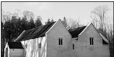
Eglwys Sant Teilo wyngalchog a godwyd yn wreiddiol ar lan afon Llŵchwr ond sydd bellach wedi ei symud i safle'r Amgueddfa Werin.

Hyn sy'n egluro pam fod Wardeiniaid Eglwys Cybi wedi dewis gwyngalchu ddwywaith yn 1746 wedi iddynt dderbyn llythyr gan Esgob Bangor yn dweud ei fod